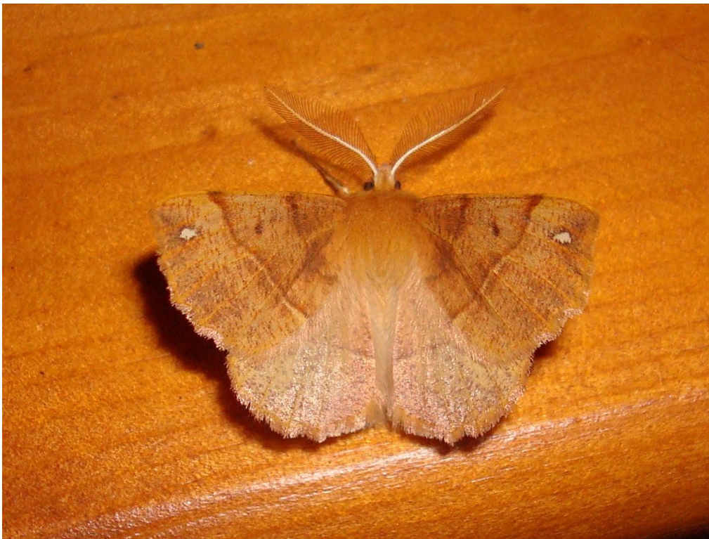
Spinnarmätare, Colotois pennaria . Statargatan Surahammar.

Mötet avslutades i förvissning om att starar och lärkor snart landar i Surahammar.