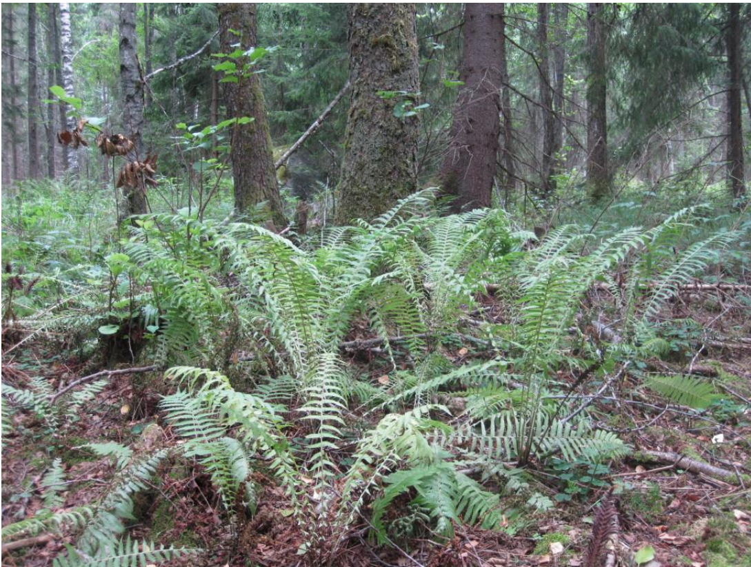
Strutbräken, söder Baståsen. 7/8 2013.