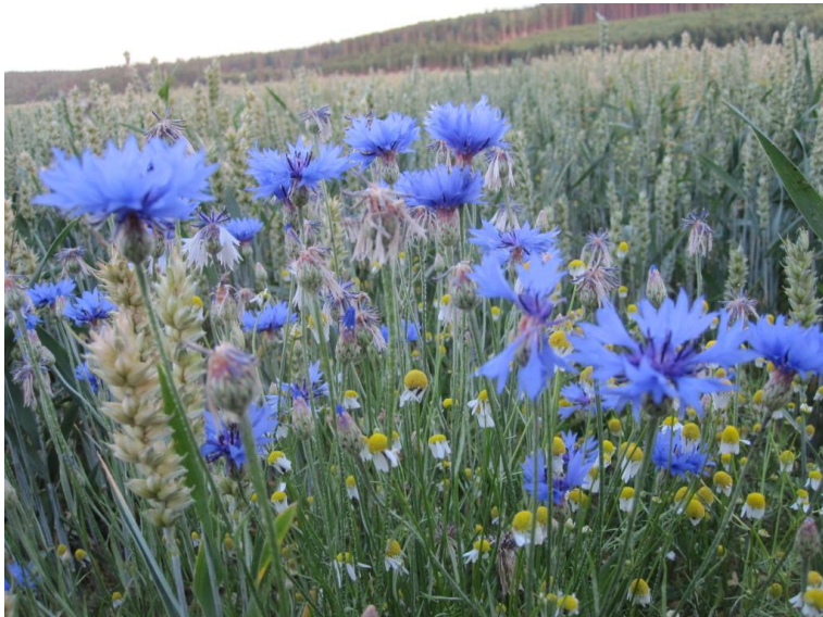
Blåklint i veteåker, Svarthäll, Kung Karl s:n, Södermanland, 11/7 2011.

Årets växt 2014 är slätterblomma. Den finns däremot inte i helåkersbygden utan i skogs- och myrlandskapet. Den är inte vanlig men kan påträffas här och var där det är lite rikare våtmarksmiljöer. Lär mer om slätterblomman i den virtuella floran .