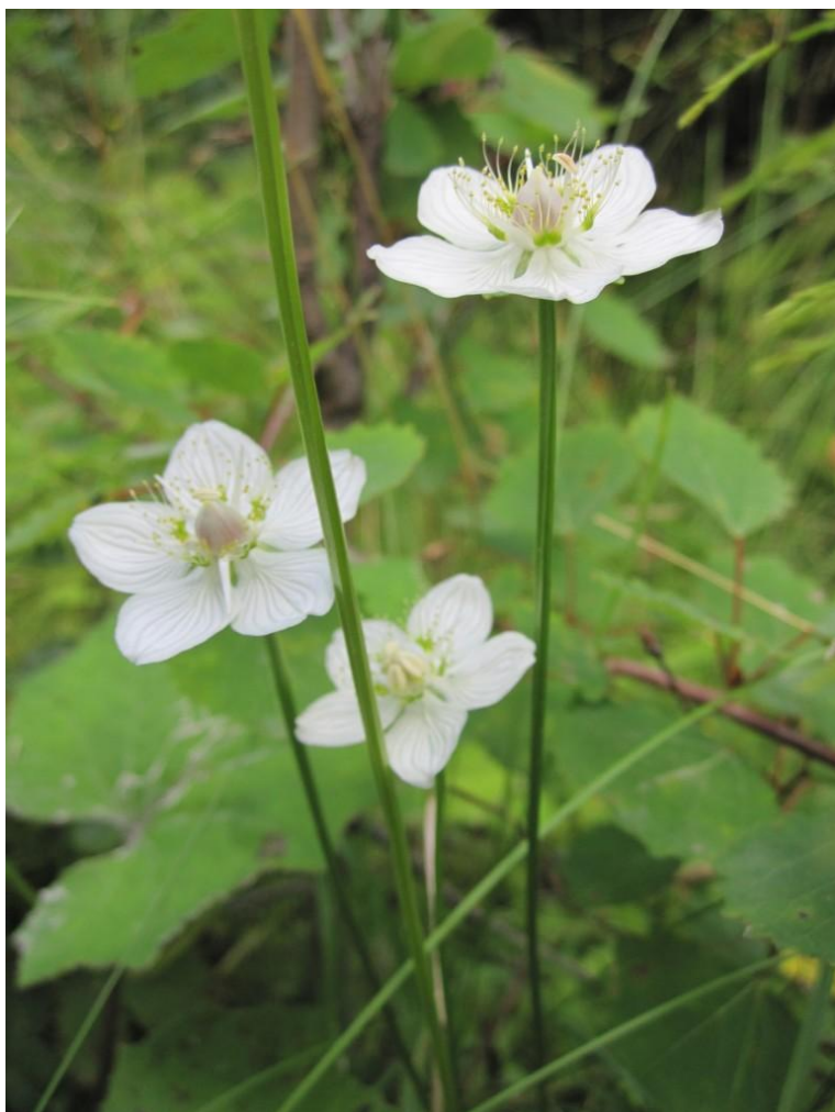
Slätterblomma Stormosskogen, Ramnäs, 15/8 2013.