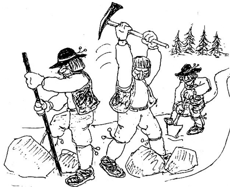
Dalkarlar byggde vägen 1763-65

Ända in i våra dagar kunde man följa Dalvägen mellan Källmora och Trappan. Jag brukade gå den några